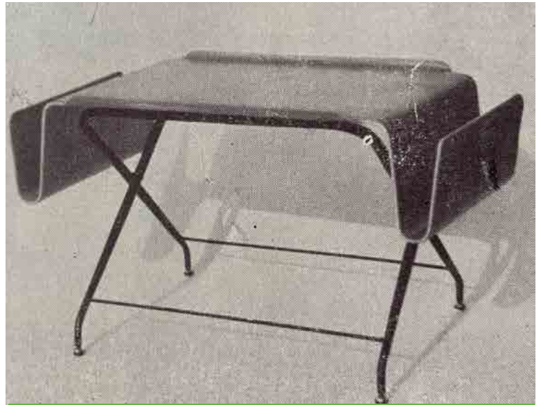
Vassoio per letto con supporto pieghevole