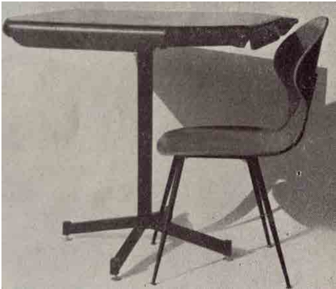
Tavolo da gioco con sedia Lulli