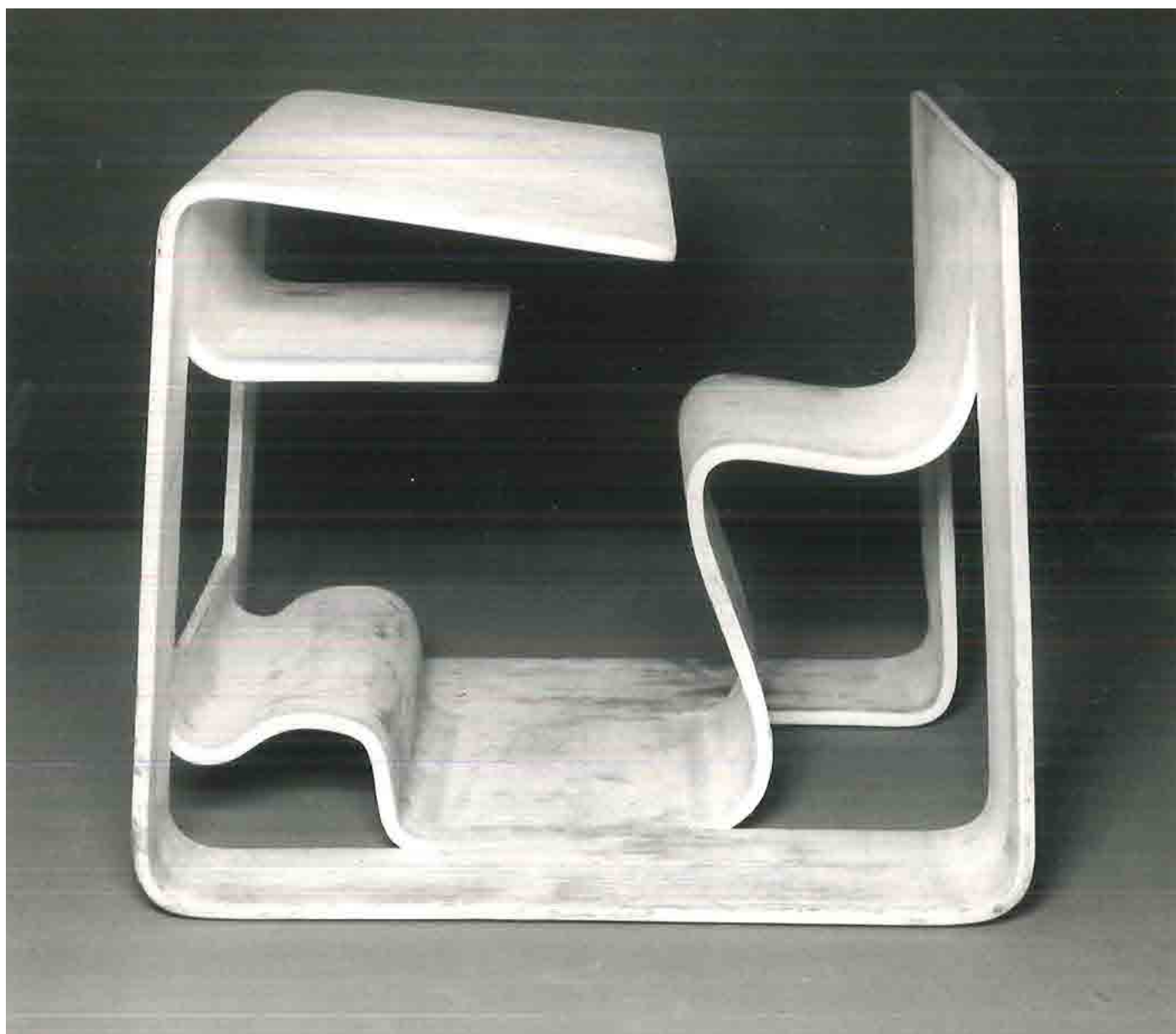
Banco di scuola

Bello ricordare le persone del passato che hanno avuto idee geniali e che hanno fatto la storia del design, soprattutto quando si parla di mobile: da cenerentola del settore industriale a grande protagonista.