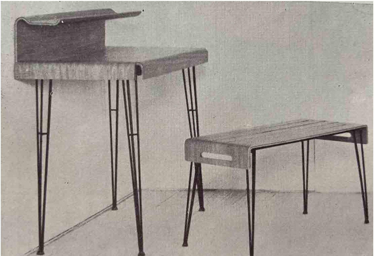
Segan Scrivanietta per albergo